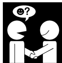
26.01.2017 STAP 3