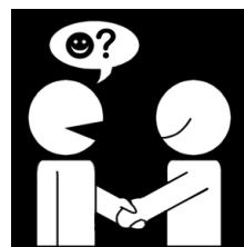
28.11.2017 STAP 3