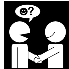
25.01.2018 STAP 3